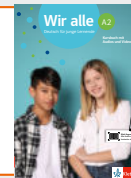
Wir alle A2