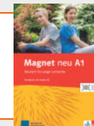
Magnet neu A1