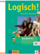
Logisch! neu B1