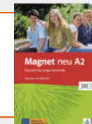
Magnet neu A2