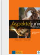
Aspekte junior B1+