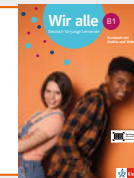
Wir alle B1