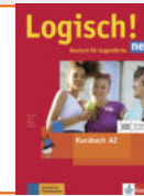
Logisch! neu A2