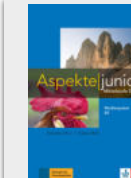
Aspekte junior B2