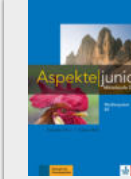
Aspekte junior B2