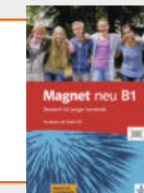
Magnet neu B1