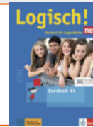
Logisch! neu A1