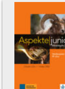
Aspekte junior B1+